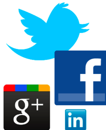
写真 を中心としたSNSを利用！