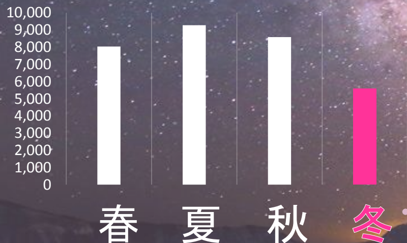
平成27年度季節別観光入込客(単位:人)