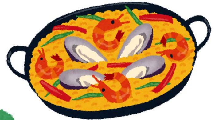
カメノテのパエリア